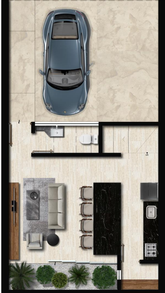
PLANTA BAJA Construidos 70.94 m 2 Jardín 3.39 m 2