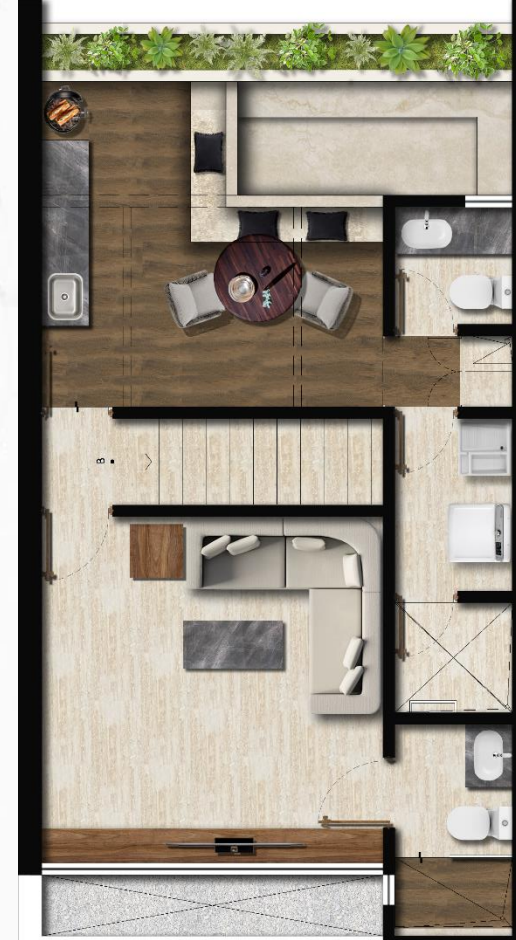
SEGUNDO NIVEL Techado 43.20 m 2 Pérgola 11.74 m 2 Terrazas s/techar 15.27 m 2